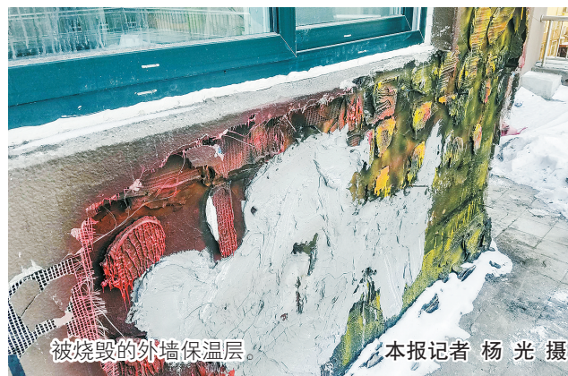
被烧毁的外墙保温层。