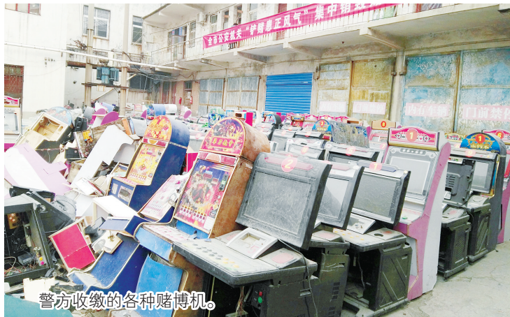
警方收缴的各种赌博机。