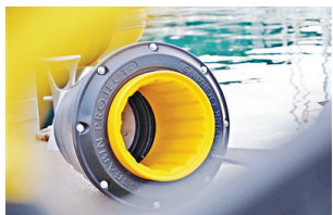
没装垃圾的“海洋垃圾桶”。