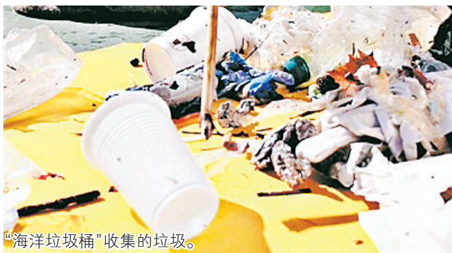
“海洋垃圾桶”收集的垃圾。

如此大量的垃圾,仅靠人工打捞费时费力且收效甚微。有幸的是,一款名为“海洋垃圾桶”的发明在经历最后的实验阶段后,已开始悄然出现在西班牙、芬兰、新西兰、英国等国家的一些码头。