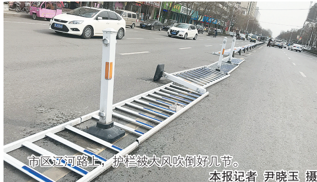
市区辽河路上，护栏被大风吹倒好几节。