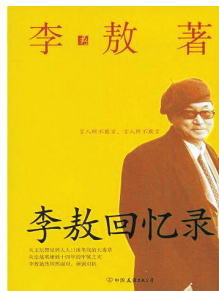
《李敖回忆录》 中国友谊出版公司 2009年1月出版