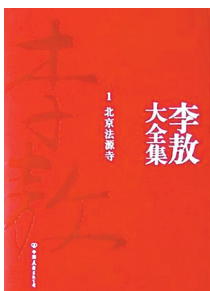
《李敖全集》 中国友谊出版公司 2010年7月出版