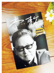
《李敖自传》 人民文学出版社 2018年1月出版