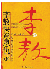
《李敖快意恩仇录》 中国友谊出版社 2004年8月出版