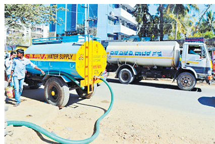
班加罗尔居民不得不依赖运水车用水。

素有印度“硅谷”之称的班加罗尔市眼下正遭遇严重水荒，一方面是由于连年干旱，另一方面是由于河流污染以及缺乏有效储水和节水措施。