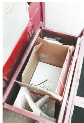
□文图 本报记者 尹晓玉