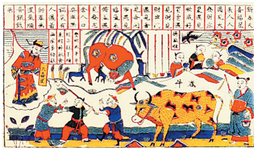
清代山东潍坊杨家埠年画《春牛图》。

把春当成“岁之始”，在先秦周代已形成，但《春秋公羊传》所谓“王正月”并非指现在的正月，相当于现在阴历十一月。这说明早期“岁之始”的“春”并不是以春季或立春为起始点，春乃“开岁”之意，与反映气候变化概念的“春”并不一致。为什么会这样？《汉书·天文志》称：“正月旦，王者岁首；立春，四时之始也。”意思是，正月初一是君王规定的一年之首，而立春则是四季的开始。早期中国历书中的“岁首”不同，是因为“王者岁首”：夏代