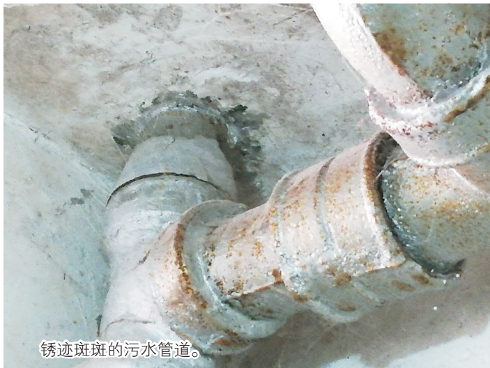
锈迹斑斑的污水管道。