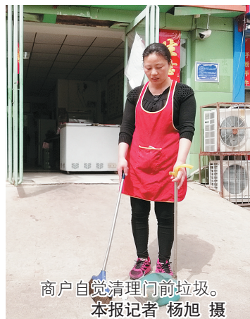
商户自觉清理门前垃圾。