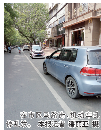
在市区马路街，机动车乱停乱放。