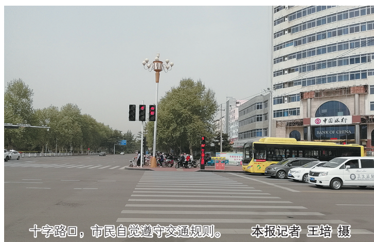
十字路口，市民自觉遵守交通规则。

生活在干净、整洁、有序的环境中是广大市民的共同愿望。对于每个漯河人来说，我们对这座城市有着由衷的热爱，每一棵小树、每一朵花儿，都是那么令人舒心，我们有理由和义务为我们的城市梳妆打扮，更有信心和能力为我们的城市增光添彩。 “创文”工作开展以来，城市环境不断改善，城市管理水平不断提升，市民文明素质也明显提高……各级各有关部门的持续发力，社会群众的广泛参与，让我市“创文”工作取得了一定成绩。但同时我们还应看到，我们离文明城市的标准还有一定的距离。几天来，晚报记者走上街头，走进社区，见证“创文”工作成绩的同时，也拍下了一些不文明现象。