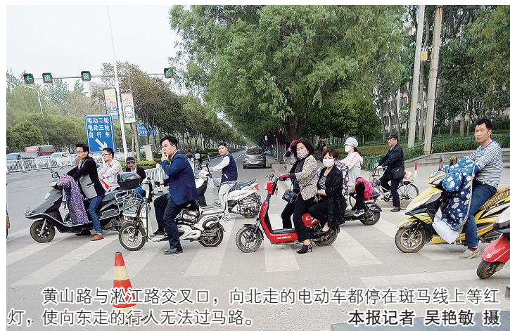
黄山路与淞江路交叉口，向北走的电动车都停在斑马线上等红灯，使向东走的行人无法过马路。