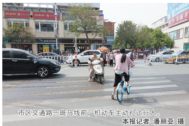
市区交通路一斑马线前，机动车主动礼让行人。