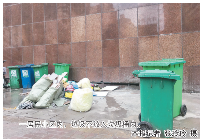
一居民小区内，垃圾不放入垃圾桶内。