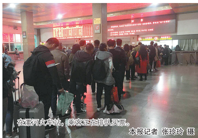
在漯河火车站，乘客正在排队买票。