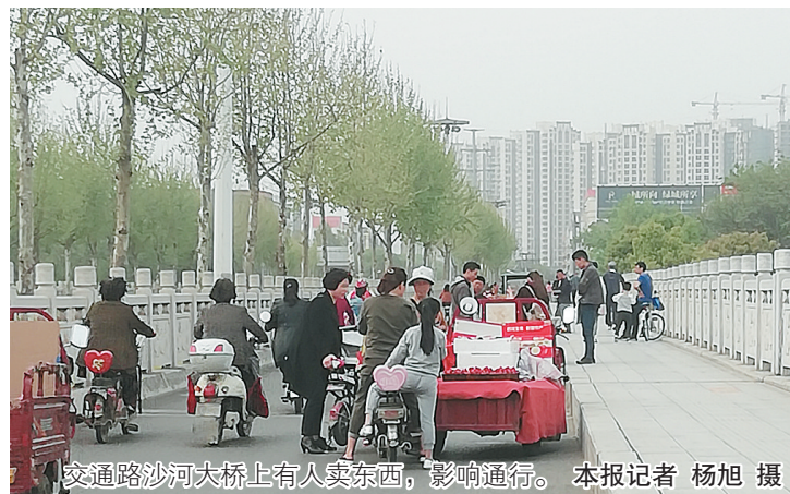
交通路沙河大桥上有人卖东西，影响通行。