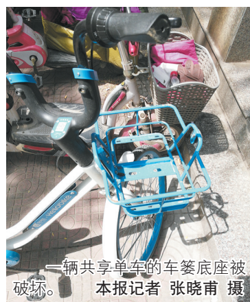
一辆共享单车的车篮底座被破坏。