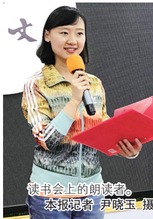
读书会上的朗读者。

本报讯(记者 尹晓玉)“我有一所房子,面朝大海,春暖花开……”4月12日晚上,市区嵩山东支路一间写字楼里传出琅琅读书声。当晚,一群读书爱好者,举办了主题为“我和春天有个约会”的读书会。