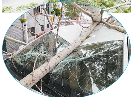
师女士的车受损严重。