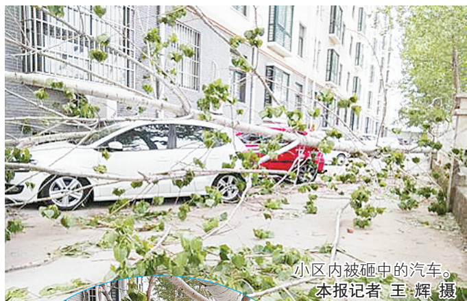
小区内被砸中的汽车。