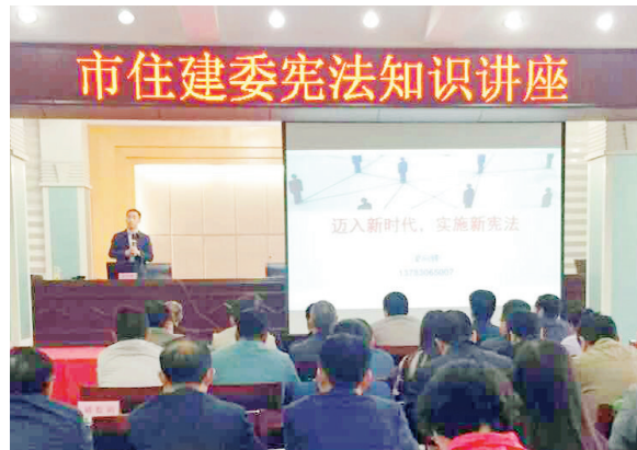
4月25日,市住建委举办学习宪法知识专题讲座,提升委系统广大党员干部的宪法意识和法治素养,营造全系统尊法学法守法用法的浓厚氛围。