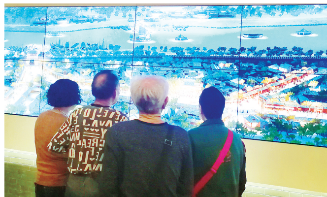
老爸老妈们正在参观城市展示馆。

本报讯(记者 刘彩霞)5月13日上午,老爸老妈俱乐部工作人员组织会员们走进漯河市城市展示馆,了解感受漯河的变化。