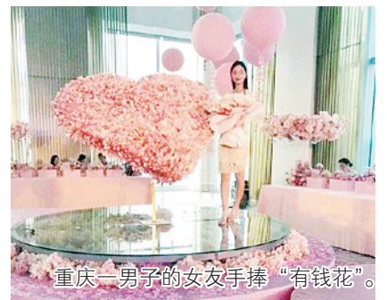
重庆一男子的女友手捧“有钱花”。

日前，重庆一名男子花33万余元人民币现金做成“有钱花”为女友庆生的视频走红，引起网友热议。那么，这种做法是否违反相关法律法规呢？