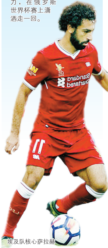
埃及队核心萨拉赫

2018年俄罗斯世界杯将于6月14日正式开始。对于参加本届世界杯的非洲队和亚洲队来说,夺取冠军并不是他们设定的目标,不过亚非球队在世界杯上都有过冲入四强的记录,因此这次这十支亚非球队也将会拼尽全力,在俄罗斯世界杯赛上潇洒走一回。