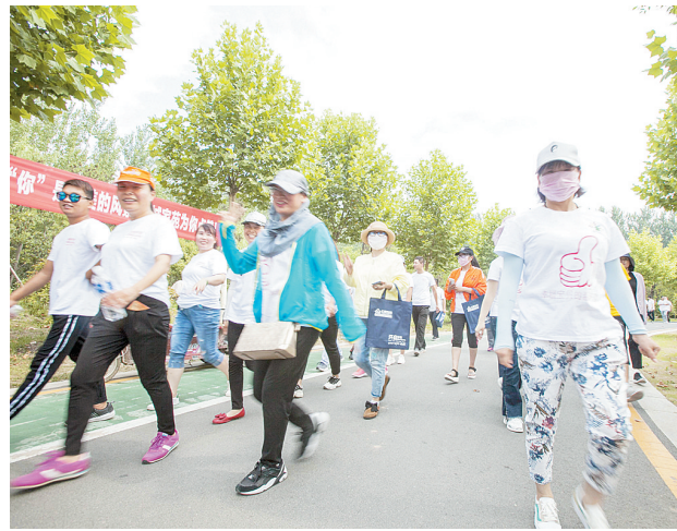
徒步大会活动现场。