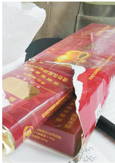
赵先生买的烟，还有一条没有抽。

本报讯(记者 王辉 实习生 何爽)结婚办喜事，烟酒糖茶每一样都要准备好，特别是香烟要准备充足。为此，市民赵先生到市区五一路南头一家商店买了7条香烟，花了1400多元。没想到，烟居然是假的！这让他很气愤。为此，他投诉到烟草、工商、公安三个部门。5月30日晚上，三部门联合执法将涉事商店查处，没想到不仅查出了假烟，还查出了假酒。