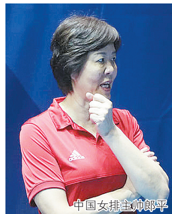
中国女排主帅郎平

国际排联2018世界女排联赛小组赛上周全部战罢，中国女排在斯图加特站后两场比赛中先后不敌荷兰女排和土耳其女排，以总排名第九名身份收官本届赛事小组赛。五站小组赛仅取得七胜八负战绩的中国女排，要如何瞄准总决赛？