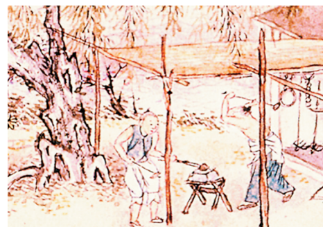
清代徐扬绘《姑苏繁华图》中的铁匠铺，铁匠等手工业者也要纳税。

匿税行为不仅影响国家财政收入，而且对其他纳税人也严重不公，所以历代对偷漏税行为都是严惩不贷。除了足额追缴税款，还得增缴罚款，要吃官司。以明朝为例，对一般的隐匿商税，《大明律·户律五·课程》规定：“凡客商匿税，及卖酒醋之家不纳课程者，笞五十。物货酒醋一半入官。”对传统的田赋，《大明律·户律二·田宅》规定：“凡欺隐田粮，脱漏版籍者，一亩至五亩笞四十，每五亩加一等，罪止杖一百。其田入官，所隐粮粮，依数征纳。”