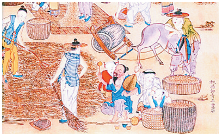
←清代天津杨柳青版画《庄家忙》描绘的“麦口天”农忙场景，过去农民要纳“田赋”。