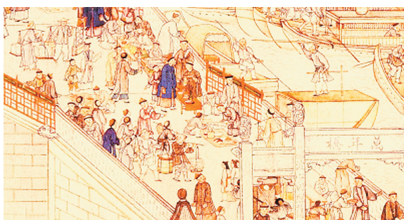
清代徐扬绘《姑苏繁华图》中的桥头地摊，要缴“市税”。

对富商大贾。 征收商品、田宅交易税时，古人则通过不立交易书契或不如实写明交易额的方式匿税，如一千钱的交易写成五百钱报官纳税，真实交易私下完成，这就是“大小书契”现象，系通过“伪造文书”偷漏税行为，现代影视圈流行的所谓“阴阳合同”，滥觞即在此。 早在先秦周代，对不如实填写交易的匿税行为已有强行规定：“卖儻(yù)者质剂焉，大市以质，小市以剂。”这里的“质”与“剂”，即买卖成交的单据或发票(契券)，长券为