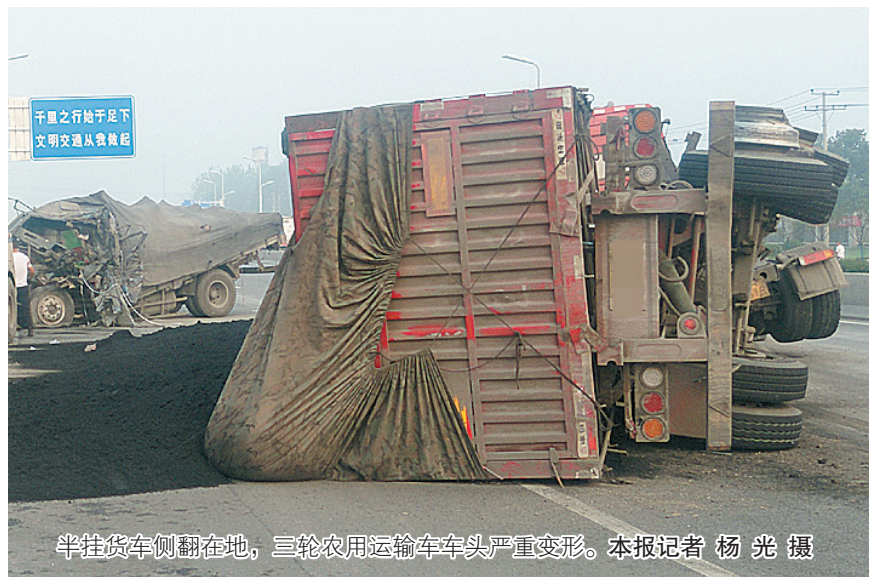
半挂车侧翻在地,三轮农用运输车车头严重变形。

本报讯(记者 杨光)7月6日凌晨4时许,市区龙江路京广铁路立交桥西约150米,道路中心隔离带南侧的车道上,一辆由东向西行驶的半挂车,与一辆由西向东行驶的三轮农用运输车发生碰撞,三轮农用运输车司机当场死亡。