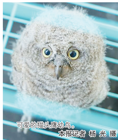
可爱的猫头鹰幼鸟。

史先生把猫头鹰幼鸟暂时安置在一个筐子里,并求助本报。记者随即联系了舞阳县森林公安分局,民警李晓飞、左志强到现场查看,仔细观察后未发现幼鸟受伤。民警在史先生家周边搜寻,也没有发现猫头鹰巢穴。由于幼鸟不具备野外生存能力,为了给猫头鹰幼鸟找到一个归处。当