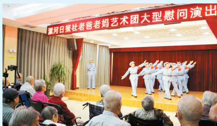
歌伴舞《闪闪的红星》