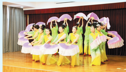
扇子舞《小小茉莉花》