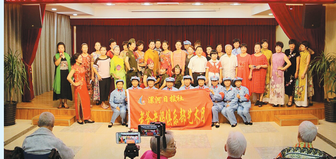
老爸老妈俱乐部艺术团现场合影。