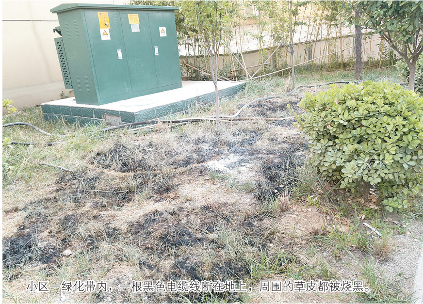
小区一绿化带内，一根黑色电缆线断在地上，周围的草皮都被烧黑。