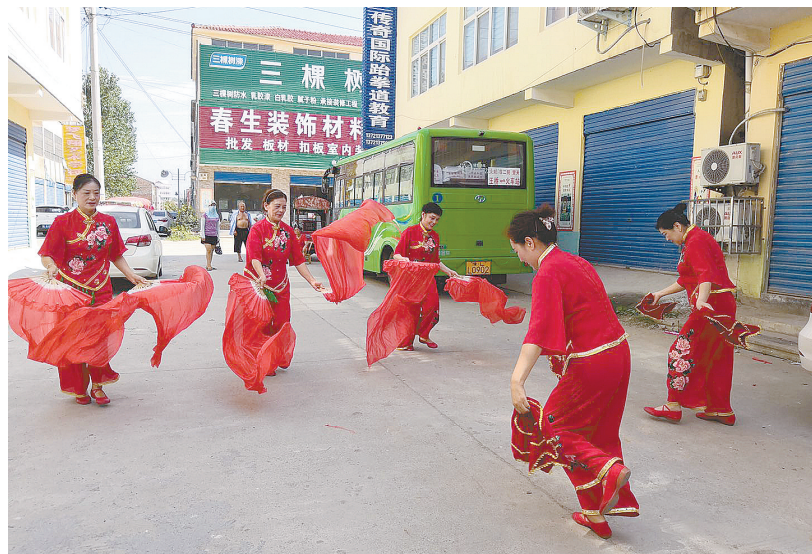
7月26日，源汇区顺河街街道戏楼后街社区文艺志愿服务队来到大刘镇，给村民们带来了精彩的文艺演出。