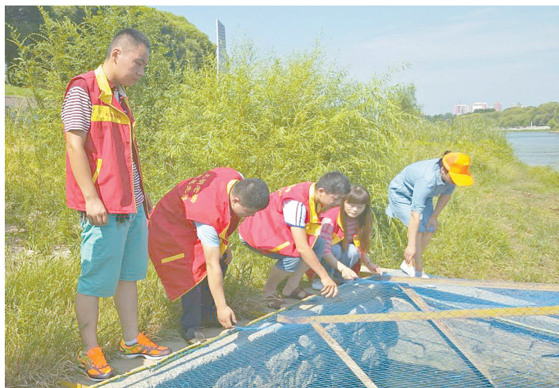
7月26日，源汇区老街街道滨西社区的志愿者们，在老街街道工作人员的带领下，对沙河滨河路路段进行了巡查。图为志愿者查看一处排污口的安全情况。