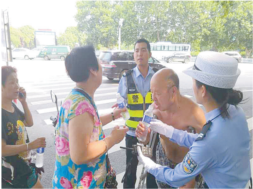
辅警认出走失老人，并安抚老人的情绪。