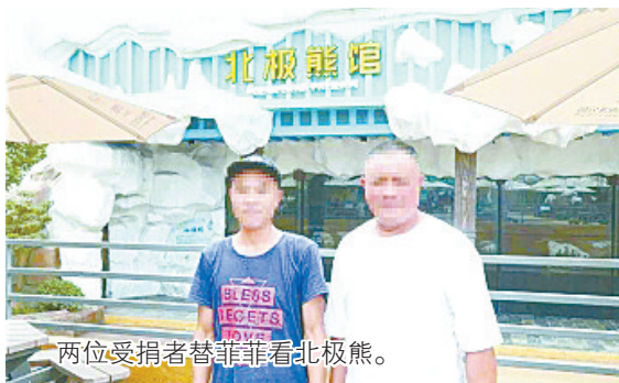
两位受捐者替菲菲看北极熊。