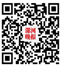
漯河晚报微信公众号