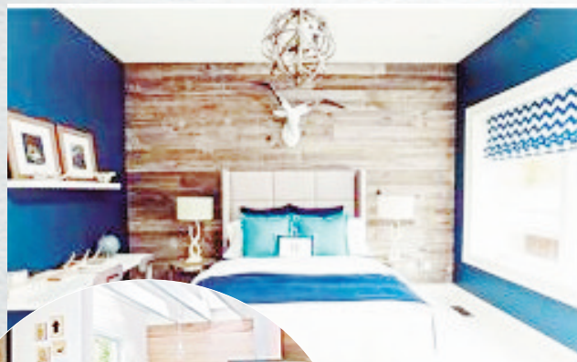
▲卧室里的木地板背景墙。