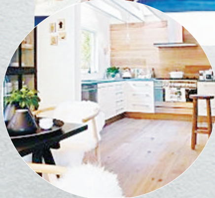
◀厨房的木地板背景墙。