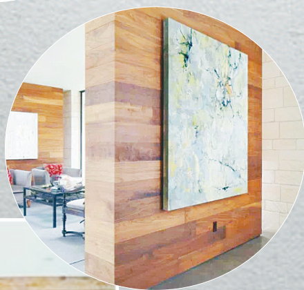
▼浅色木地板上墙后看起来简单、干净。