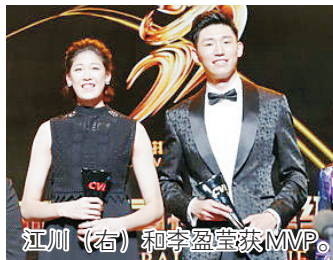
江川(右)和李盈莹获MVP。

8月7日晚,2017~2018赛季中国女排超级联赛颁奖典礼在天津市文化中心大剧院隆重举行。最有价值男女球员分别颁给北京男排的江川和天津女排新锐李盈莹。由于带队备战亚运会,中国女排主帅郎平并未到场。