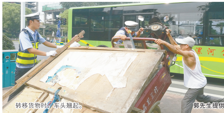
转移货物时,车头翘起。