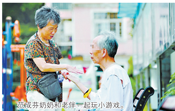
范成芬奶奶和老伴一起玩小游戏。