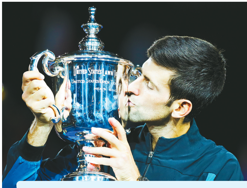
小德在颁奖仪式中亲吻奖杯。

在北京时间9月10日晨进行的美国网球公开赛男单决赛中，塞尔维亚球星德约科维奇直落三盘，以6:3、7:6(4)、6:3完胜阿根廷名将德尔波特罗，第三次问鼎美网冠军，这也是小德职业生涯第14座大满贯冠军，追平了桑普拉斯，并列大满贯男单冠军榜第三位。