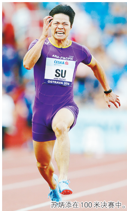
苏炳添在100米决赛中。

国际田联洲际杯大赛是以洲为单位，共有四支队伍参赛，分别是欧洲队、美洲队(包括南、北美洲)、亚太队(包括亚洲和大洋洲)及非洲队。各单项比赛中，每个代表队派两位选手参加，全部项目均为8人出战，直接进行决赛。本次洲际杯最终美洲队获团体冠军，欧洲队第二，亚太队第三，非洲队第四。 晚综