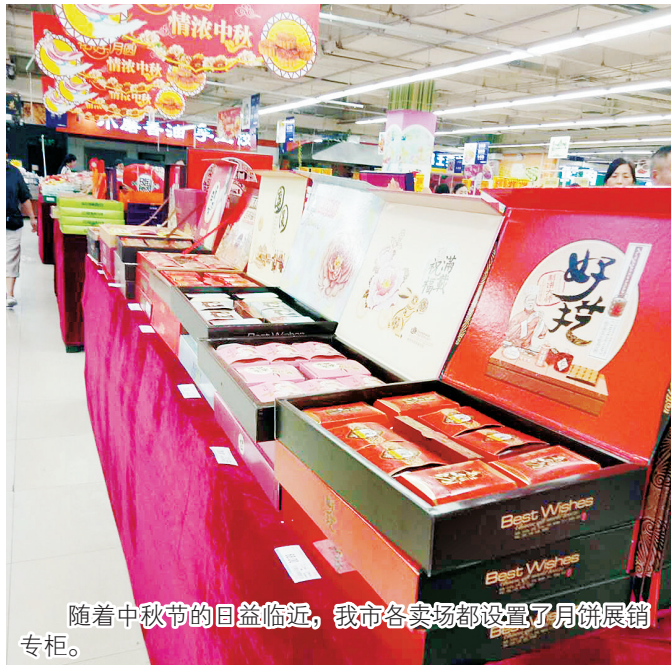
随着中秋节的日益临近,我市各卖场都设置了月饼展销专柜。

随着中秋节临近,月饼价格战也悄然打响。9月11日上午,记者刚走进辽河路一家卖场,月饼销售区的促销人员就