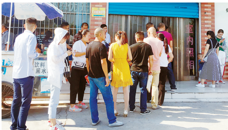
市车管所驾驶人体检中心外,市民排起长队。

很多人在排队照相。一家商店的负责人告诉记者,进入9月份以来,报名的人尤其多,市民一个接一个地来店里拍照,他们忙个不停。记者从市区长江路一家驾校了解到,进入9月份以来,学员增加不少。