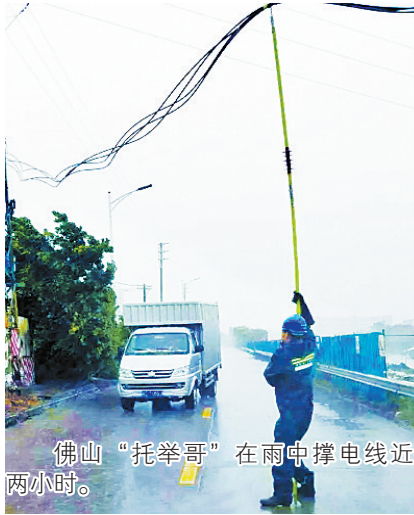
佛山“托举哥”在雨中撑电线近两小时。

“我现在在火宅现场,正在排查是否有伤员,医疗急救组随时待命。”16日下午6时,来自武警广东省总医院急诊科