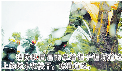
消防队员冒雨拿着锯子锯断道路上的树木和枝干,疏通道路。