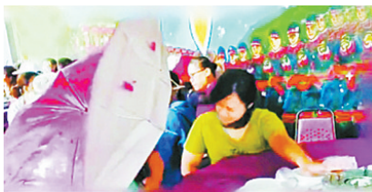
宾客们撑开雨伞试图抵挡风雨。

9月15日,受超强台风“山竹”外围环流影响,中国台湾多地遭遇狂风暴雨。屏东一对新人恰巧在这日举办婚宴,席开60桌,谁知现场屋顶被掀,大红饭桌被吹翻满场跑,最后宴席由60桌变为30桌。但是这对淡定的新人仍坚持举办婚宴,称要“携手一起走过这个风浪”。而宾客也在风雨中照常用餐,并幽默表示,难得一见,“我们都很紧张地在吃,因为害怕屋顶铁皮掉下来。”