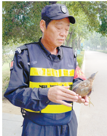
保安高会棋救助小池鹭。

长着尖尖的长嘴,待在一个纸箱里,瞪着圆圆的眼睛警惕地打量着四周。看到有人靠近,它就伸出长嘴做出啄人的样