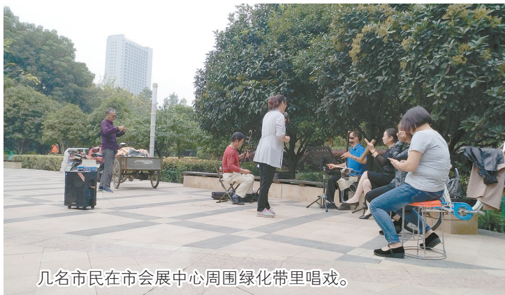
几名市民在市会展中心周围绿化带里唱戏。