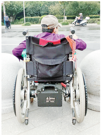
石墩间距小,轮椅过不去。