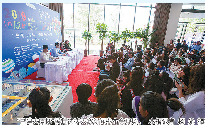
“昌建大厦杯”模特选拔大赛新闻发布会现场。

本报讯(记者 杨光)10月13日下午,“昌建大厦杯”2018中原国际少儿时装周模特选拔大赛(漯河站)启动仪式暨新闻发布会在昌建大厦营销中心盛大举行。记者了解到,本届大赛是2018中原国际少儿时装周的重要组成部分,主办方为河南省模特协会、中原国际时装周组委会,承办方为昌建大厦。