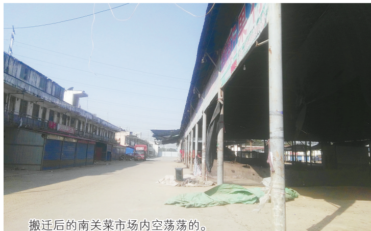
搬迁后的南关菜市场内空荡荡的。