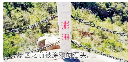
景区之前被涂鸦的石头。

近日,山东青岛市崂山风景区内出现多处“澎湃”及相关字样的涂鸦,景区呼吁涉事者主动接受调查。10月16日下午,崂山风景区官方微博发布消息称,涂鸦涉事者于当日上午主动向崂山警方投案,其网名和微信名都是“澎湃”。