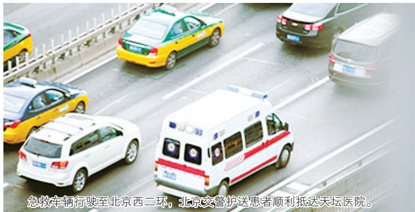
急救车行驶至北京西二环,北京交警护送患者顺利抵达天坛医院。