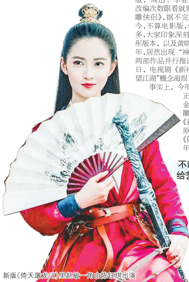
新版《倚天屠龙记》里赵敏一角由陈钰琪出演