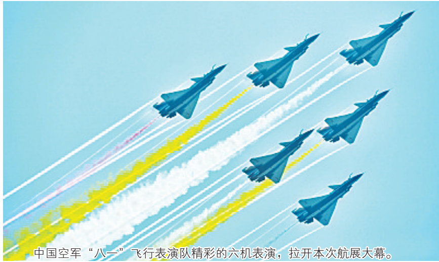
中国空军“八一”飞行表演队精彩的六机表演,拉开本次航展大幕。