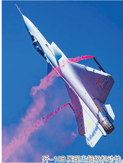
歼-10B展现出超级机动性。