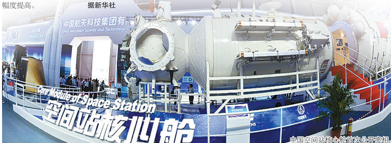
中国空间站核心舱首次公开亮相。