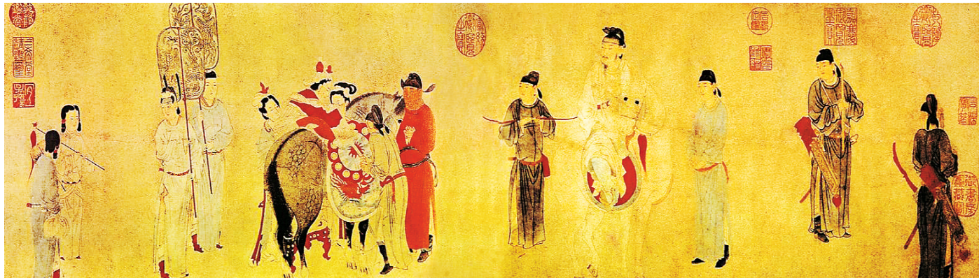
五百里加急的快马被用来给杨贵妃运送新鲜水果。

不仅如此,古代的物流虽然远不如今天这样便捷,但也有了蔬果生鲜的“快递服务”,甚至还出现了最早的“海外购”。