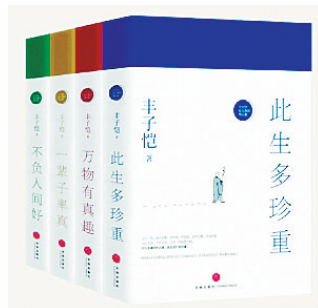
《此生多珍重》四书 丰子恺 著 天地出版社