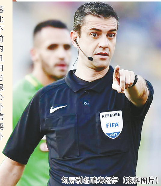
匈牙利名哨考绍伊 (资料图片)

2018中超联赛落幕，通过对全年240场比赛裁判员名单的统计，不难发现，中国足协季前“每轮邀请外籍裁判”的目标已经落到实处，而且绝大多数外籍裁判被使用到了每一轮的关键场次当中，这在一定程度上确保了比赛的公平、公正、公开。但在个别场次中，外籍裁判并没有拿出令人信服的表现，也就是说，要实现“每轮邀请高水平外籍裁判”这个目标，相关部门仍然需要做大量的工作。