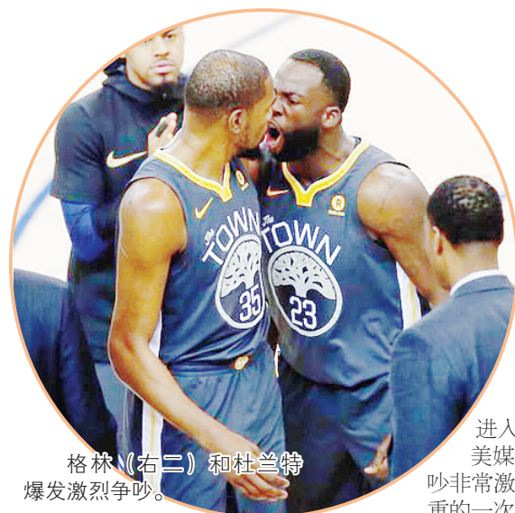
格林（右二）和杜兰特爆发激烈争吵。

第三届洛阳白云山杯中国围棋棋圣战由中国围棋协会、河南省体育局、洛阳市人民政府主办，冠军奖金80万元、亚军20万元。 据新华社