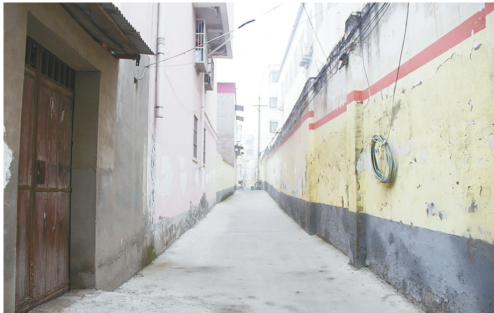
酒馆胡同不长,长度有150米左右,宽大概2米。