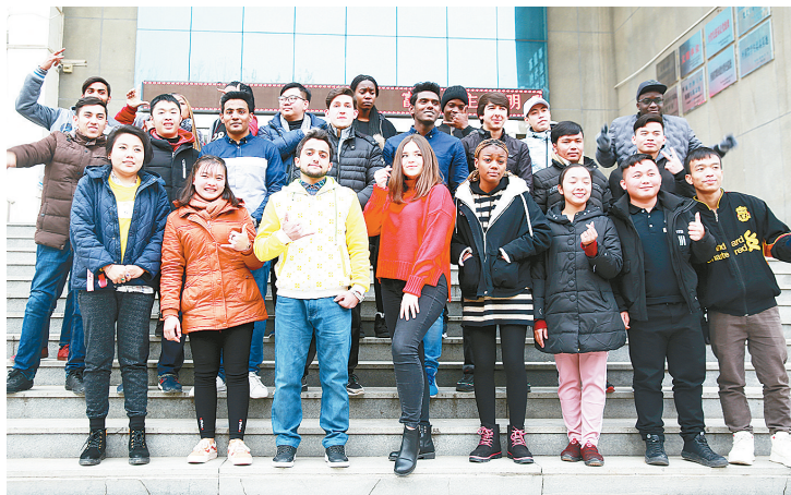
留学生与漯河医专其他学生合影。