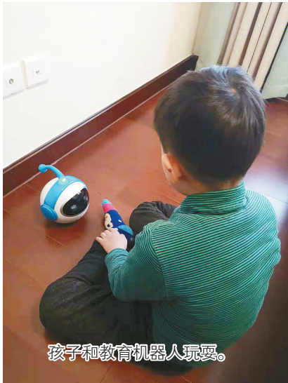
孩子和教育机器人玩耍。