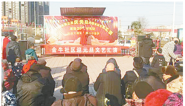
2018年12月30日下午，郾城区城关镇金牛社区在钟楼广场举行迎元旦公益文艺表演活动。唢呐独奏、戏曲等节目精彩纷呈，引得观众掌声不断。