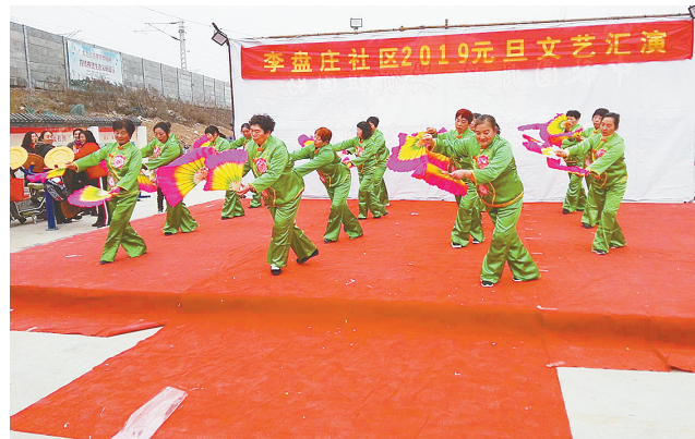
2018年12月31日下午，郾城区沙北街道李盘庄社区于举办“喜迎元旦构建和谐家园”元旦文艺汇演。演出节目丰富多彩，现场观众不住喝彩。