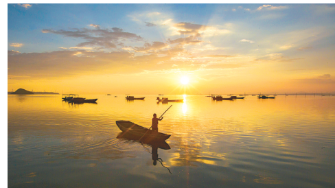
傍晚，在江西鄱阳湖都昌矶山水域，渔民荡舟湖上。