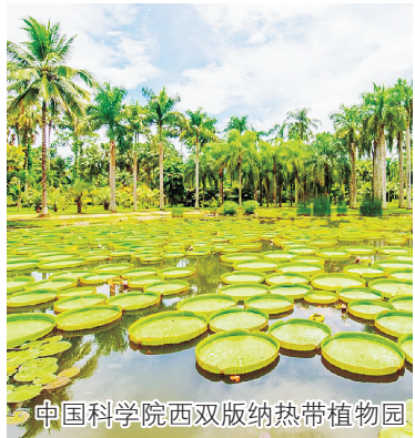
中国科学院西双版纳热带植物园

白族是一个聚居程度较高的民族，而且受汉文化影响比较深，其中，白族的三道茶最为出名。让小朋友背上采茶篮，跟着白族姑娘一起行走在一望无际的茶园小径中，一边了解茶文化，一边在专业采茶人的指导下进行茶叶的采摘，累了还可以停下欣赏美丽如画的田园风光。茶马古道同样也是云南文化中