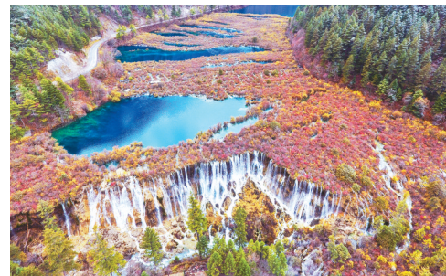
俯瞰四川九寨沟景区诺日朗瀑布景点及诺日朗群海景点。

在刚刚过去的2018年，各地摄影师用镜头记录下四季中国。大江南北，一幅幅色彩斑斓的美丽画卷徐徐展开。 据新华社