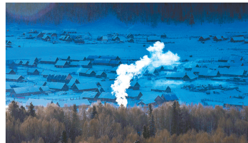
晨曦下的新疆喀纳斯禾木村。