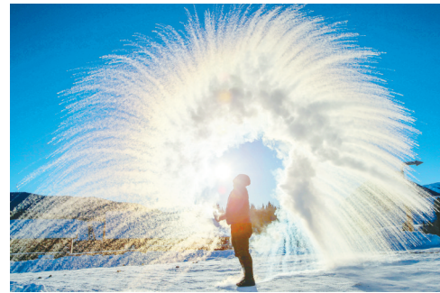
在新疆阿勒泰地区布尔津县禾木村，游客体验“泼水成冰”。