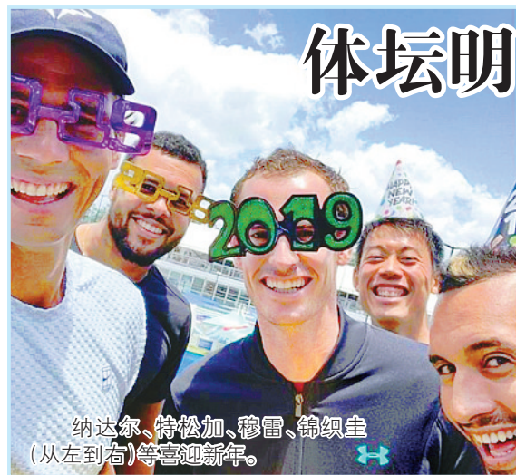
纳达尔、特松加、穆雷、锦织圭(从左到右)等喜迎新年。