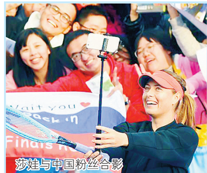
莎娃与中国粉丝合影

辞别2018,迎来饱含希望的2019。国际体坛大牌明星这两天纷纷晒照片、许心愿,喜迎新的一年。