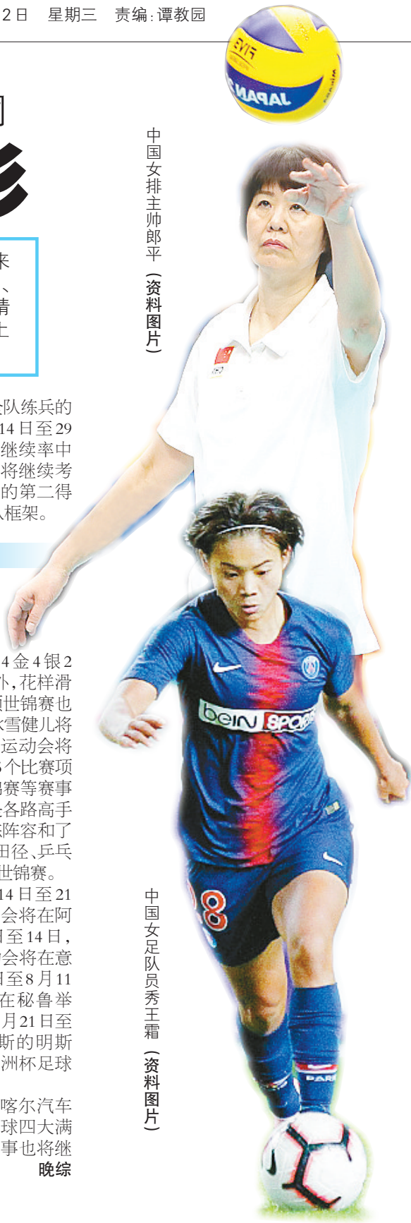
中国女足队员秀王霜(资料图片)