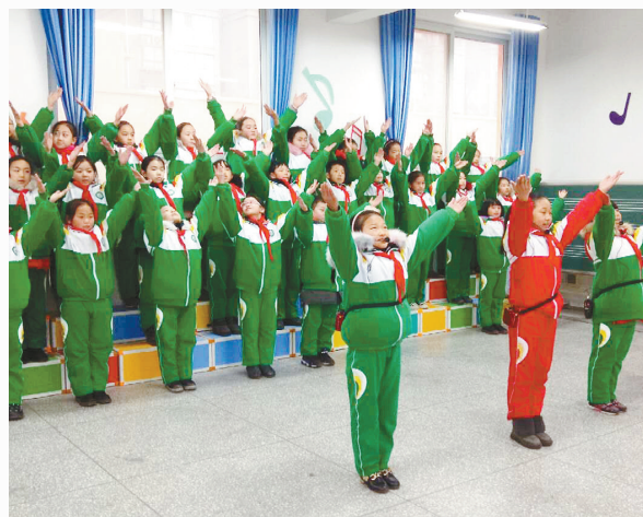
1月4日，郾城区许洼小学举行了期末社团汇报展演活动。2018年秋季开学，该校开设了葫芦丝、美术、舞蹈、武术和足球等社团。