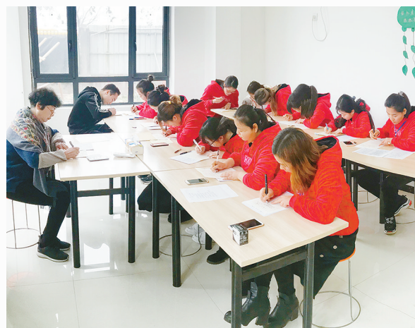
1月4日，河南省实验学校漯河学校举行了教师硬笔书法比赛。