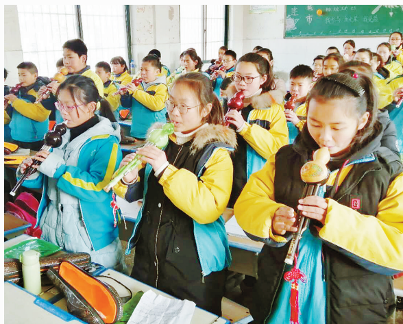
1月3日，召陵区实验中学小学部举行音乐社团展演活动。