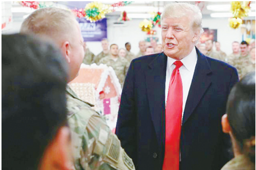
2018年12月26日，在伊拉克西部安巴尔省的阿萨德空军基地，美国总统特朗普（右）在基地餐厅会见驻伊美军官兵。

美国国务院一名高级官员1月4日说，美国不会无期限在叙利亚驻军，只是现在没有撤军时间表。